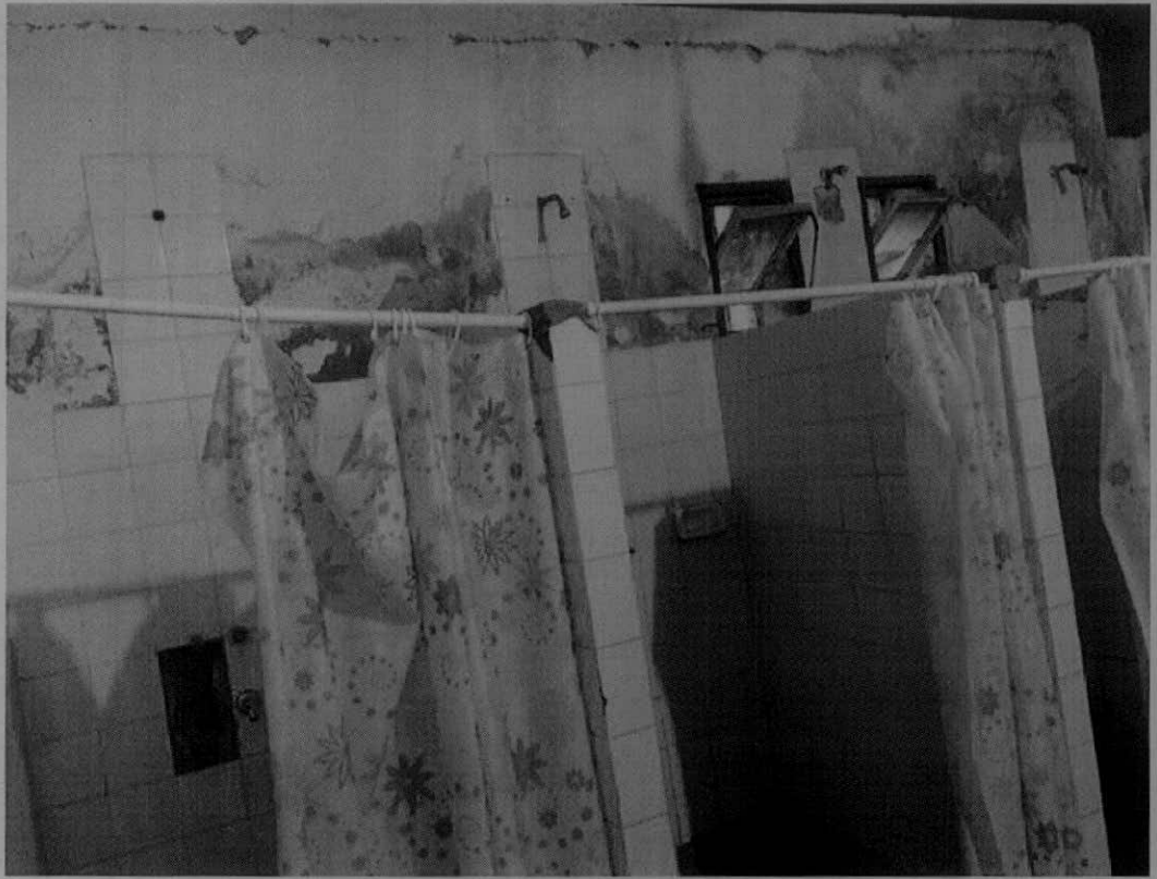
Sanitarios, sector 1