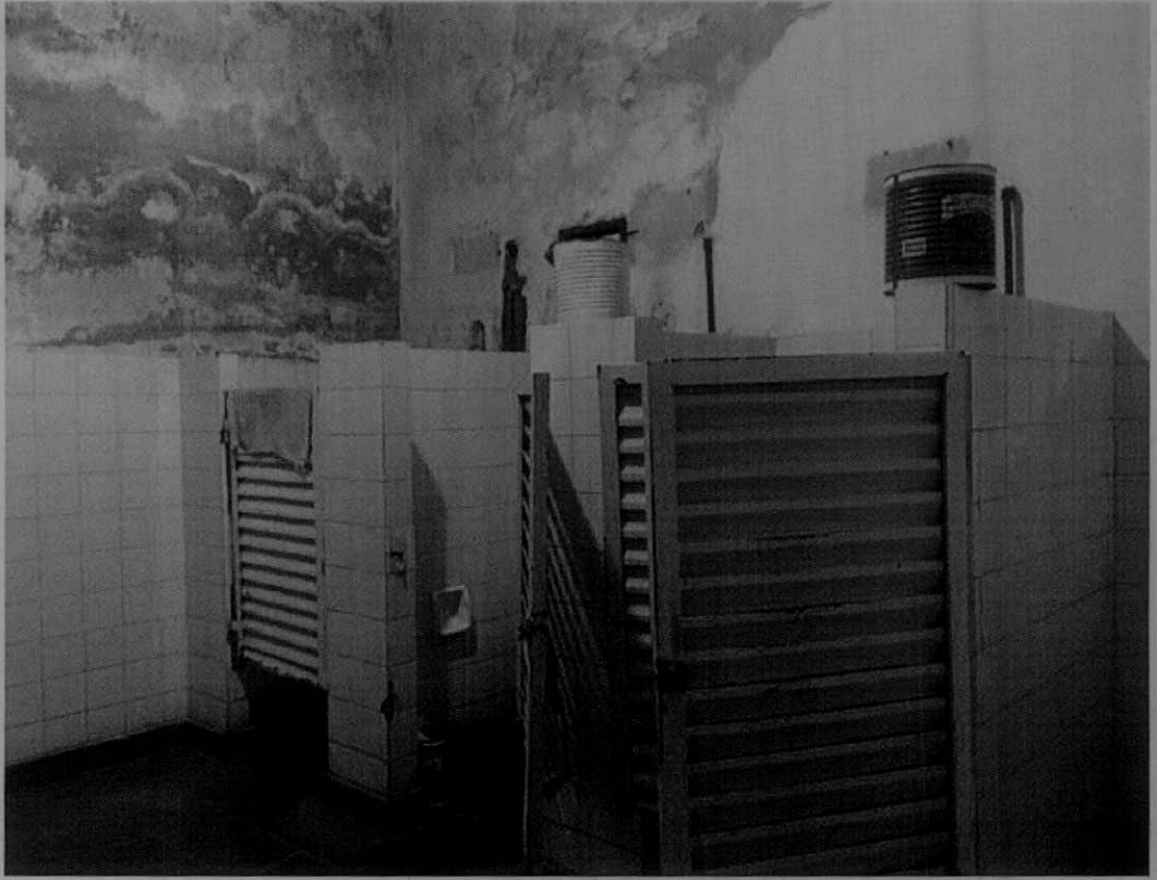
Sanitarios, sector 1